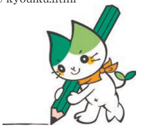
山口大学キャラクター ヤマミー