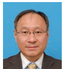
日本テキサス・インスツルメンツ合同会社 国際資材調達部 Make Japan マネージャ