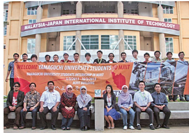
マレーシア工科大学マレーシア日本国際工科院における短期研修

学生のグローバルな視野を涵養するため、本研究科の海外提携校において短期の研修（講義の受講および現地企業の視察）を実施する。また、研修の事前・事後に研修先の国々の社会経済を理解するための学習を行う。これまでの実績としてはマレーシア工科大学マレーシア日本国際工科院やインドネシア・バンドン工科大学における短期研修がある。