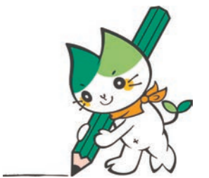
山口大学キャラクター ヤマミ