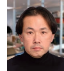
山口県 統計分析課