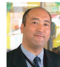
セントラル硝子株式会社 化学研究所 農学博士