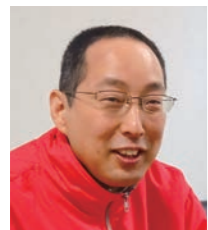
株式会社ミカサ 代表取締役社長