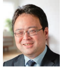
橋本食品株式会社 代表取締役社長