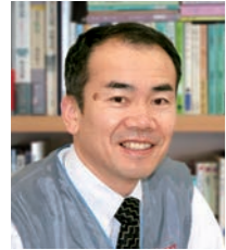
株式会社ピーエムティー 代表取締役