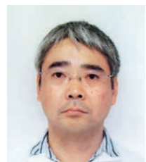
マツダ株式会社 技術研究所