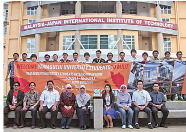
マレーシア工科大学マレーシア日本国際工科院における短期研修

学生のグローバルな視野を涵養するため、本研究科の海外提携校において短期の研修（講義の受講および現地企業の視察）を実施する。また、研修の事前・事後に研修先の国々の社会経済を理解するための学習を行う。これまでの実績としてはマレーシア工科大学マレーシア日本国際工科院やインドネシア・バンドン工科大学における短期研修がある。