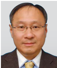
日本テクサス・インスツルメンツ合同会社 国際資材調達部 Make Japan マネージャ