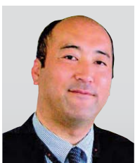
セントラル硝子株式会社 化学研究所 農学博士