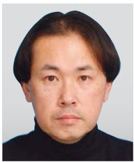
山口県 統計分析課