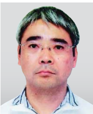
マツダ株式会社 技術研究所