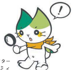
山口大学キャラクター ヤマミイ

山口大学大学院技術経営研究科 E-mail: mot@yamaguchi-u.ac.jp