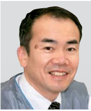
株式会社ビーエムティー 代表取締役