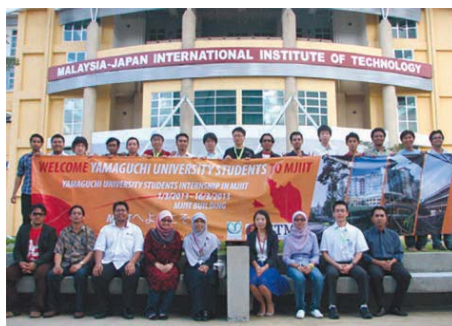
写真左： インドネシア・バンドン工科大学における短期研修