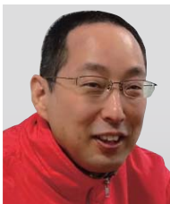
株式会社ミカサ 代表取締役社長