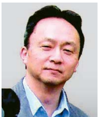
経済産業省 中国経済産業局