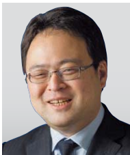
橋本食品株式会社 代表取締役社長